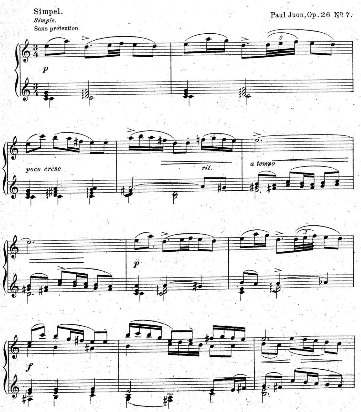
Copyright 1903 by Schlesinger'sche Buch-und Musikhandlung (Rob. Lienau), Berlin. S. 9261 (7)