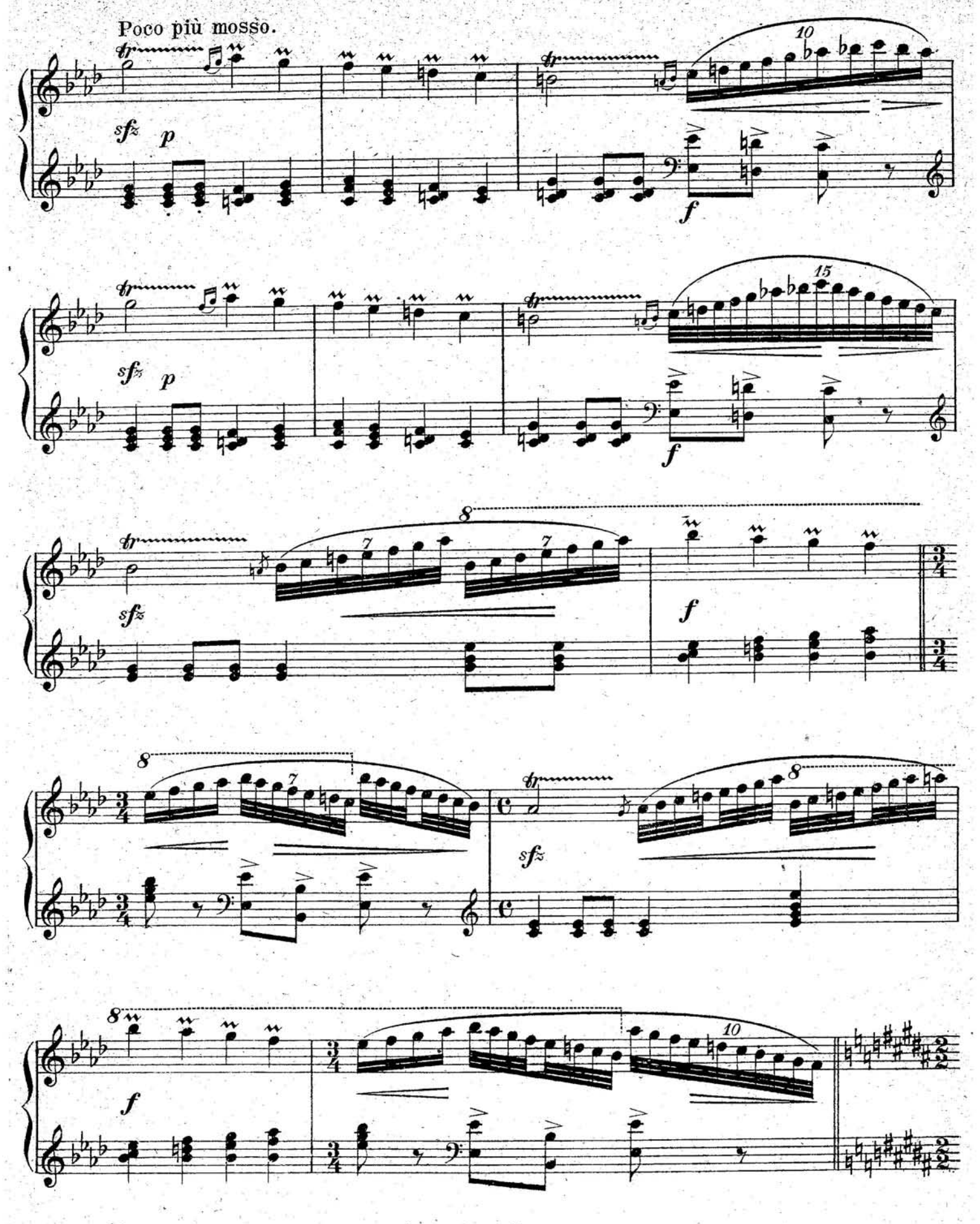
S. 9261 (10)