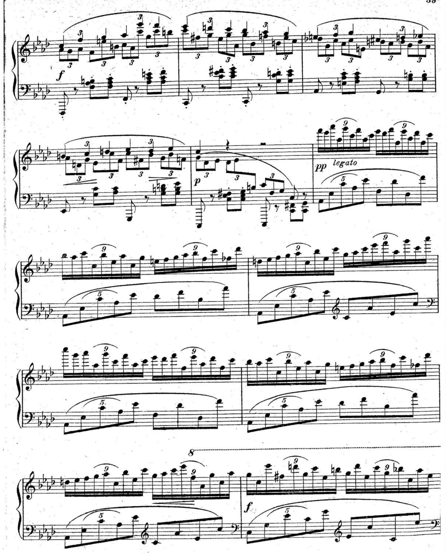
S. 9261 (10)