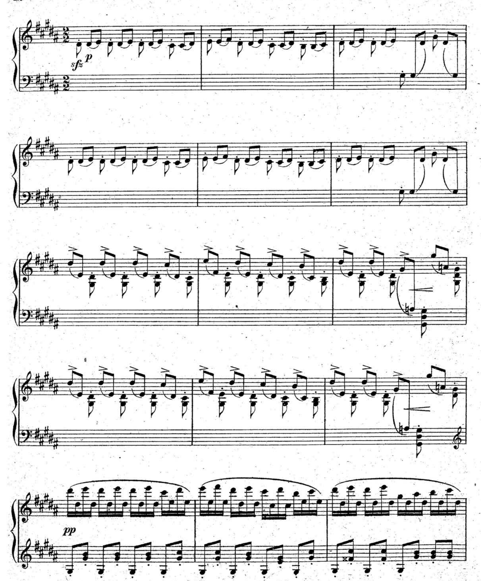
S. 9261 (10)