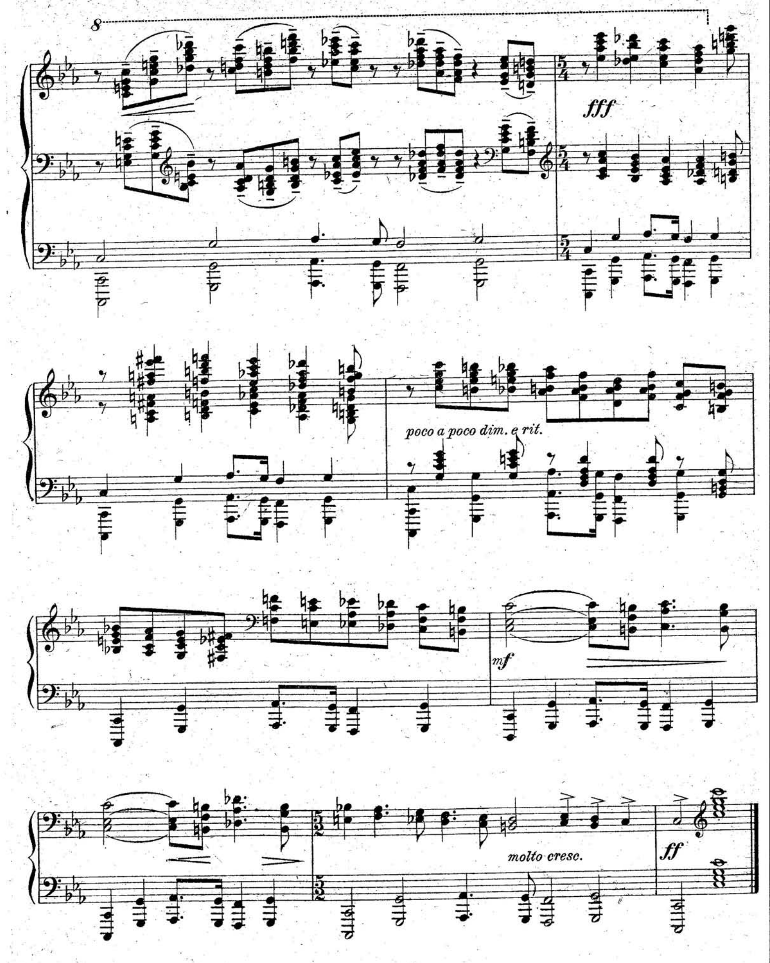
S. 9261 (8)