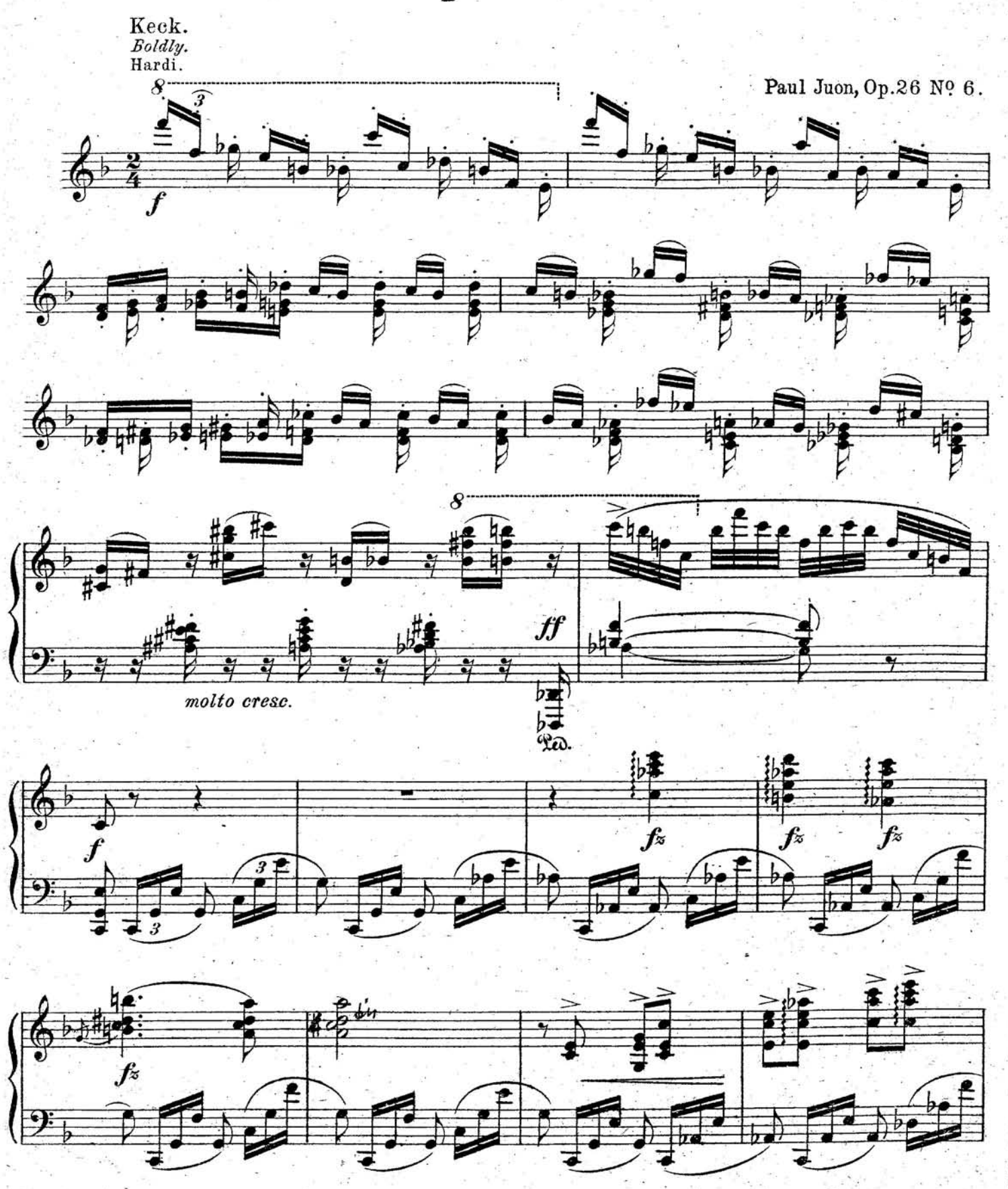
Copyright 1903 by Schlesinger'sche Buch-und Musikhandlung (Rob. Lienau), Berlin. S. 9261(6)