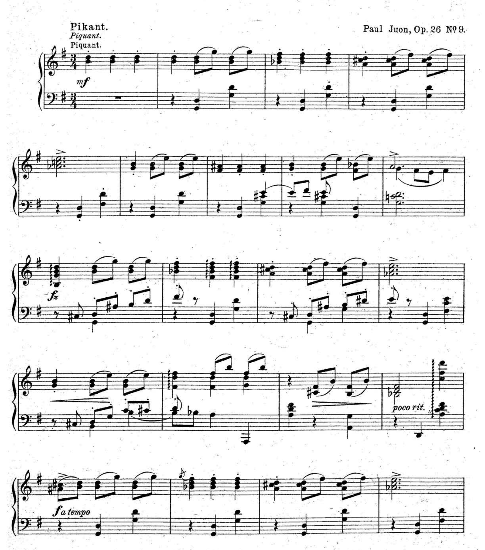
Copyright 1903 by Schlesinger'sche Buch- und Musikhandlung (Rob. Lienau), Berlin. S. 9261(9)