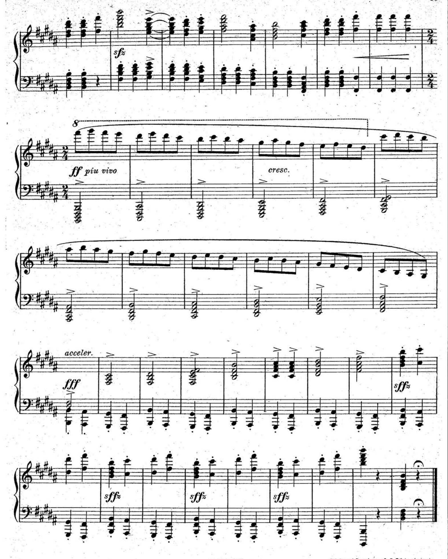
S. 9261 (10)