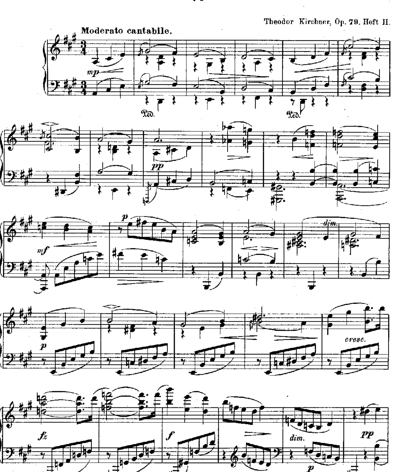
Verlag und Bigenthum von Friedrich Hefmeister in Leipzig.