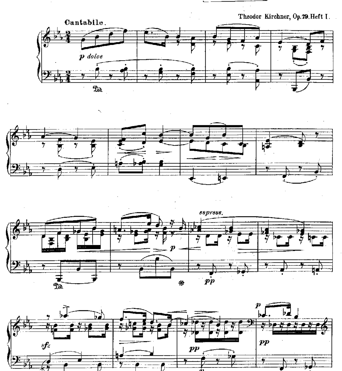
Verlag und Eigenthum von Friedrich Hofmeister in Leipzig.