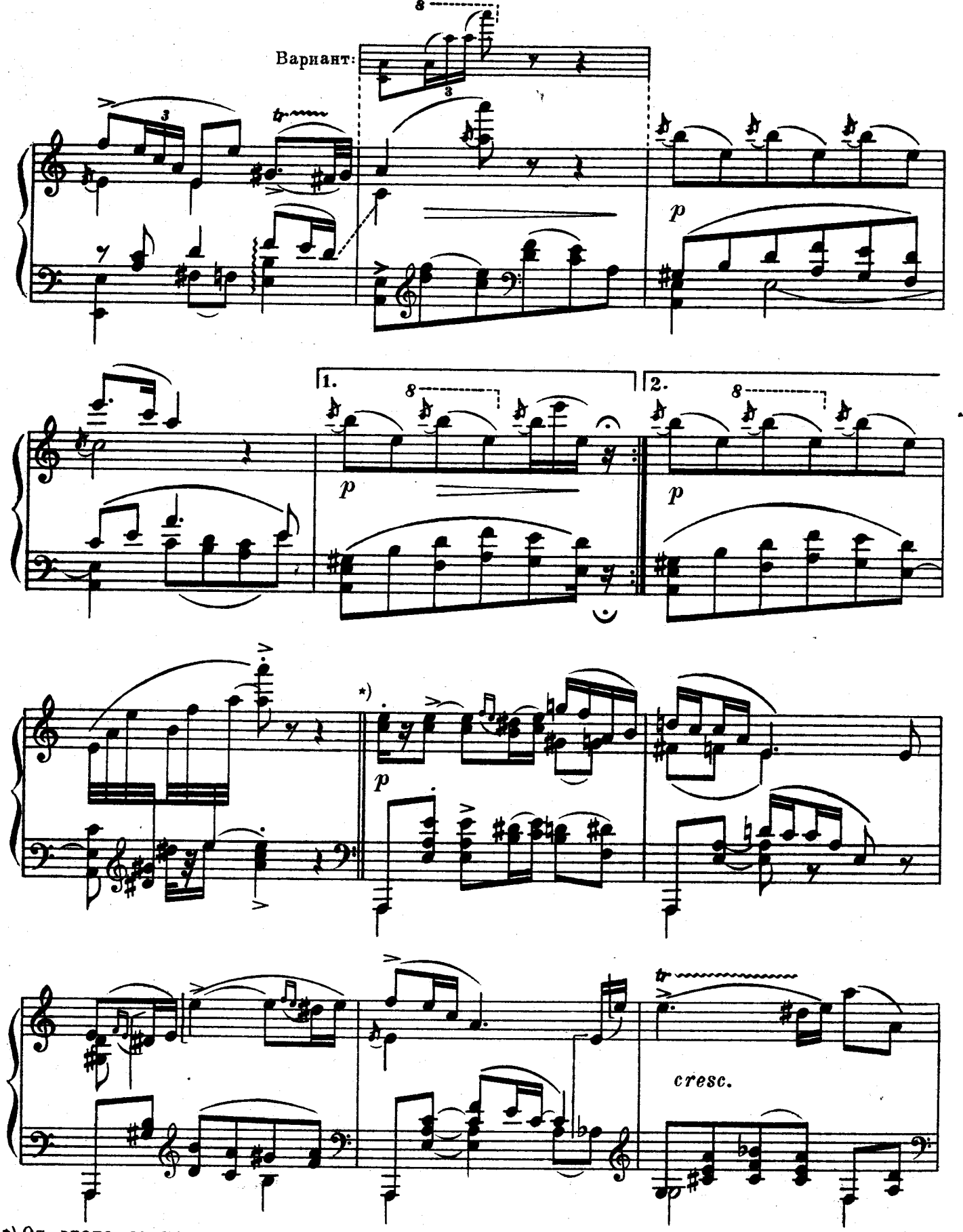
*) От этого знака по желанию исполнителя можно выпустить 20 тактов до знака **) 20832